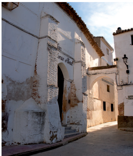
Híjar. Ermita de San Antón y antigua judería

En España solo se guardan tres ejemplares, en la Biblioteca Nacional de Madrid: un Pentateuco de Alantansi y los dos impresos conocidos de Fernández de Córdoba, el Manuale caesaraugustanum y las ordenanzas de la Santa Hermandad en el reino de Aragón. Un ejemplar de esta obra hubiera sido el único incunable de Híjar conservado en nuestra Comunidad, si no hubiera desaparecido del Archivo Municipal de Zaragoza (con referencia AMZ, Caja 512, sig. 24-7-6); lo dio a conocer, en 1927, Pedro Antonio Muñoz Casayús, que lo atribuyó erróneamente al taller zaragozano de los Hurus.